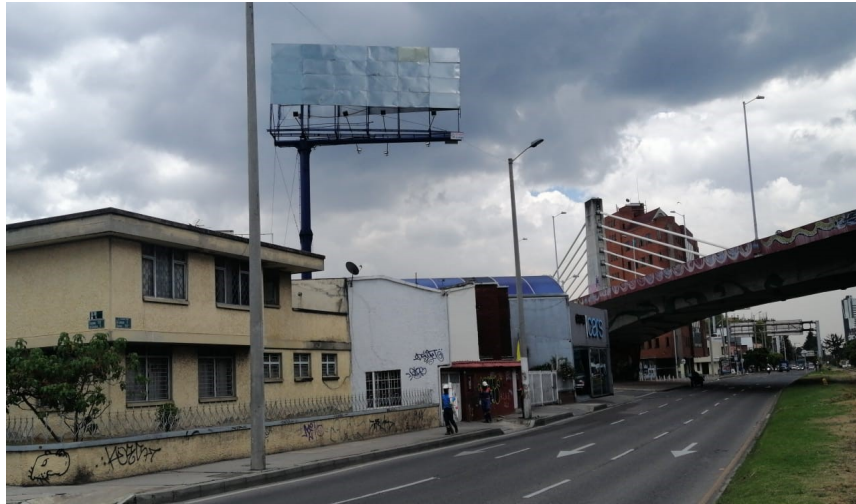
Foto No.1: Vista panorámica del predio y de la valla ubicada en la Av. Carrera 9 No. 108-42 (dirección catastral) orientación Norte-Sur