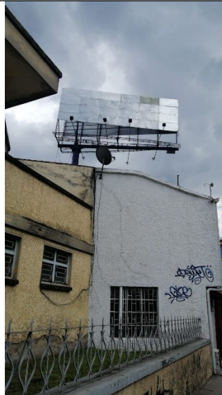
Foto No. 2: Vista del panel y de la estructura de la valla tubular, en buenas condiciones de mantenimiento, en la Av. Carrera 9 No. 108-42 (dirección catastral) orientación Norte-Sur